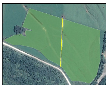
Potreros, cercos, etc.

Este correo electrónico se debe enviar antes de la hora y fecha de cierre del concurso.